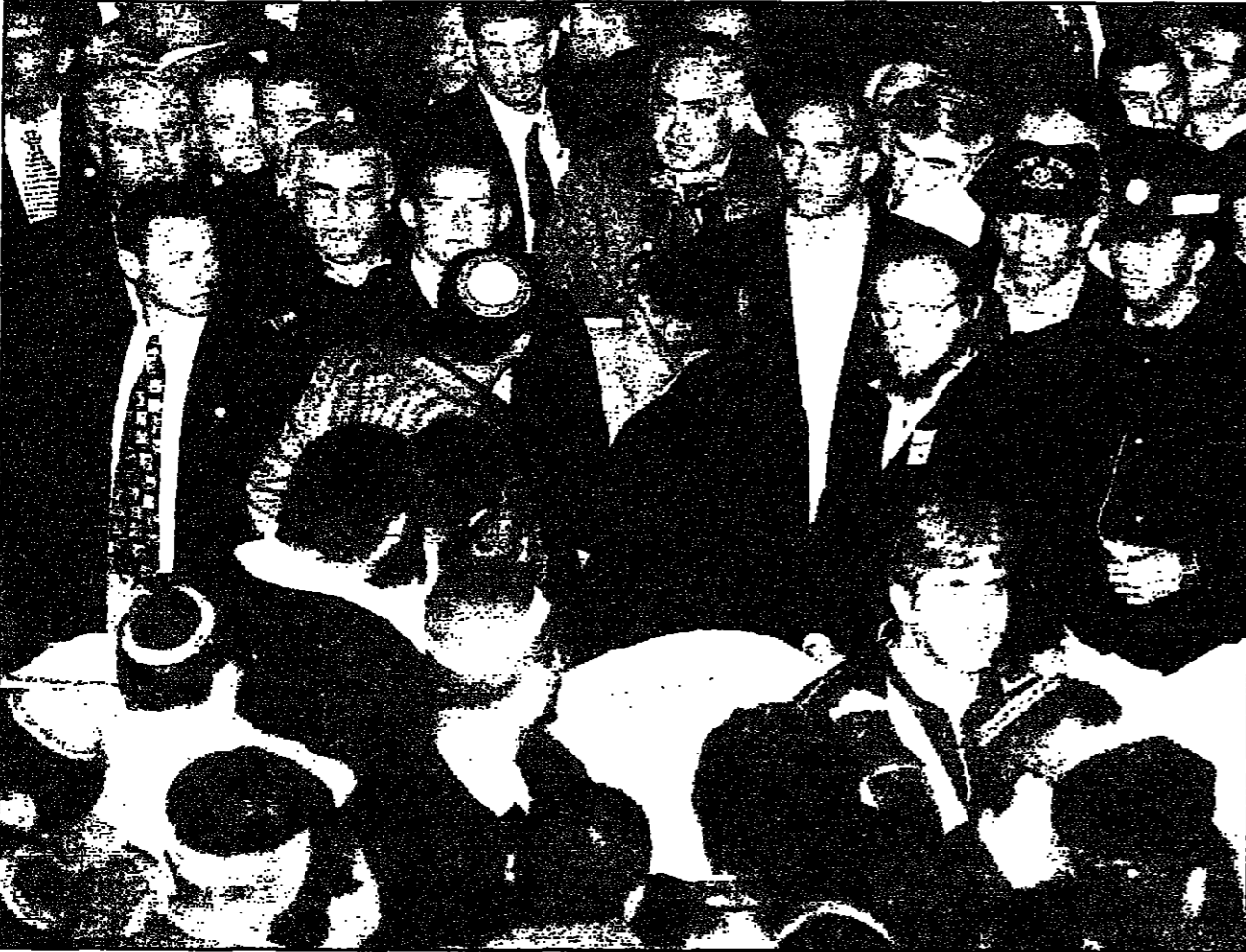
نتنياهو وباراك في تأييد 4 قنصيات من ضحايا هجوم الباقورة (رويت)